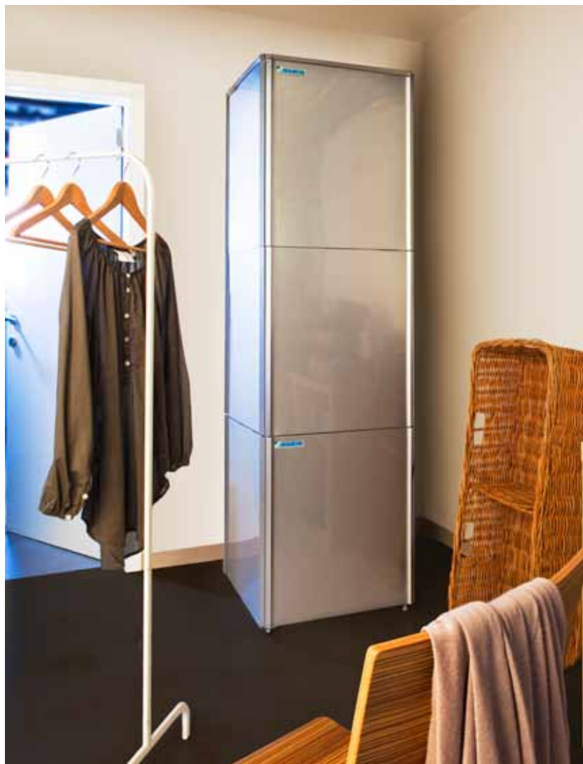
Jednostka wewnętrzna i zbiornik ciepłej wody użytkowej można ustawiać w konfiguracji pionowej

Firma Daikin zaprojektowała wysokotemperaturowy system Daikin Altherma, zapewniając nie tylko najwyższą efektywność, lecz również niskie koszty instalacji. Instalacja rurowa potrzebna do połączenia jednostki wewnętrznej i zbiornika z jednostką zewnętrzną jest ograniczona do minimum, lecz prawdziwa oszczędność kosztów polega na tym, że system został zaprojektowany do współpracy z istniejącymi grzejnikami, co sprawia, że nadaje się idealnie do przedsięwzięć renowacyjnych i eliminuje dodatkowe wydatki na wymianę układu grzewczego.